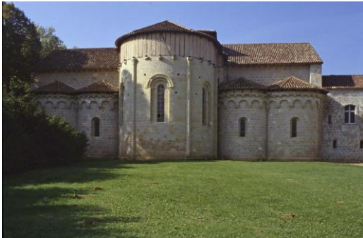
Façade est de l'église (chapelle et absidioles).