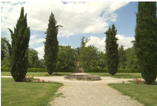
Le jardin à la française.