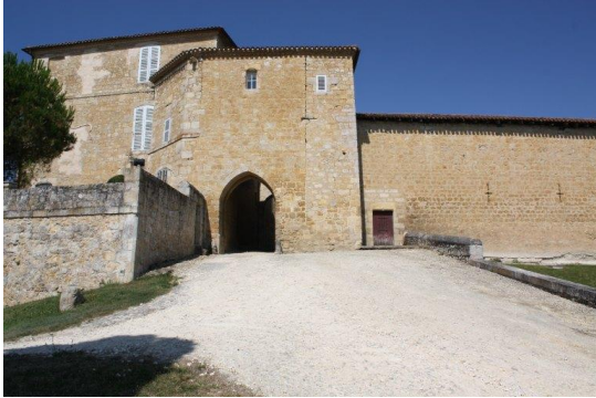
Fortification (vue d'ensemble du côté sud-est depuis le sud-est)