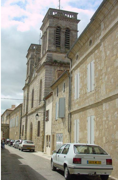
Eglise Notre-Dame-de-la-Nativité (vue d'ensemble)