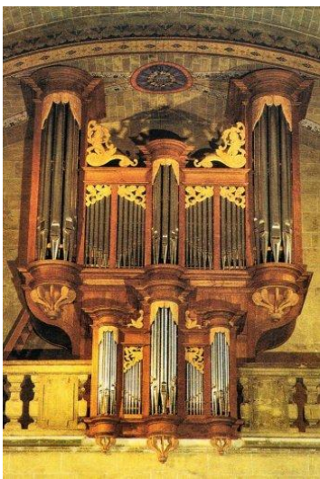
Eglise Notre-Dame-de-la-Nativité (orgue)

Eglise du 17 e siècle, située au centre du village. Façade à fronton agrémentée au 19 e siècle de deux tours culminant à plus de 18 mètres. À l'intérieur, une vaste nef du 17 e siècle abrite un imposant retable en marbre blanc, un autel d'époque Louis XVI. Orgue célèbre construit en 1983 et 1984 par Alain Leclère dans un esprit classique.