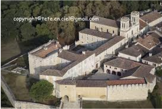
Château de Terraube (vue d'ensemble)