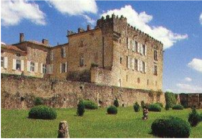
Château de Terraube (coin nord-ouest du corps principal)