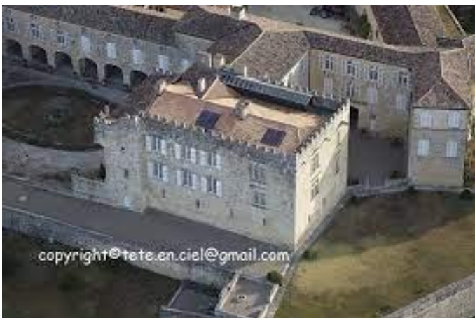
Château de Terraube (vue du corps principal)