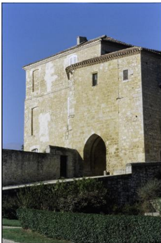
Château de Terraube (façade d'accès)

Construit vers 1272 pour la famille de Galard, issue des ducs de Gascogne.