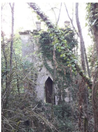
Pigeonnier ? du château (vue extérieure)