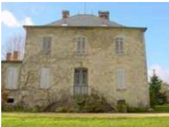
Bâtisse du Mont Saint Jean.