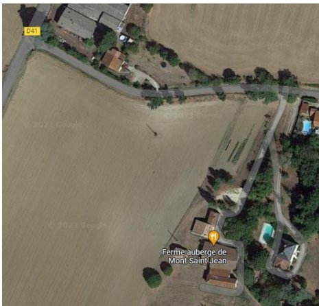
Château (en bas à droite).