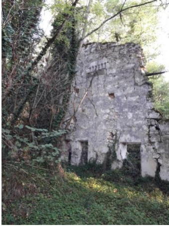
Pigeonnier ? du château (vue de côté)