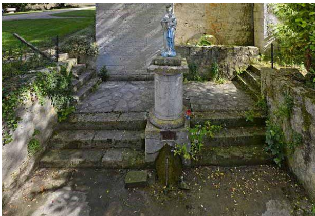
Fontaine et Vierge de la chapelle