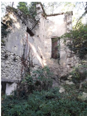
Pigeonnier ? du château (vue intérieure)