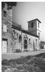
Eglise de la commanderie.

Commanderie du 12 e siècle située au lieu-dit Puy-Fort-Eguille (ou ? L'Eglise) à 3 km au sud-est de la ville près de la départementale 232. Ancien établissement templier dépendant d'Argentens, composé de l'église Saint-Jean Baptiste, de l'ancien logis, du sol de l'ancienne cour intérieure (qu'ils délimitent au Sud et à l'Ouest) et de l'ancien pigeonnier, dernier vestige de communs qui étaient disposés en U.