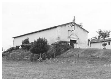
Eglise de la commanderie.