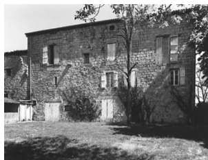
Logis de la commanderie.