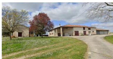
Commanderie (église à gauche et métairie à droite).

Commanderie de templiers située au lieu-dit Argentens à 1,5 km au nord-est de la ville près de la départementale 136. Commanderie existante en 1159. L'ordre de Malte en hérite au 14 e siècle. En 1650, on y dénombre une chapelle, deux maisons et une métairie avec ses dépendances. Eglise restaurée et agrandie au 17 e siècle. Sur le plan de 1769 n'apparaissent plus que l'église et la métairie. La métairie a été complètement rénovée. Propriété privée.