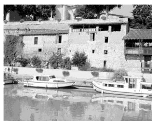
Vestiges de remparts.

* Première enceinte rive gauche existant dès la fin du 11 e siècle et entourant vraisemblablement le Quartier des Embarras (le quartier enclos) selon un arc de cercle depuis la Baise en suivant le tracé de la rue Victor Hugo, des Petites Allées et de l'avenue Mondenard. A l'intérieur de ce périmètre le quartier se structure autour de deux axes orientés est-ouest, la Grand Rue, actuelle rue Armand Fallières, au sud et la rue de l'Ecole au nord. L'espace compris entre ces deux rues s'organise sur la base d'une trame bâtie définissant des îlots orthogonaux. Le secteur situé au sud de la Grand Rue est principalement occupé par le château et l'église Saint Nicolas. L'accès à cet espace urbain se fera par les rues Saint Germain et Sully (Grande Rue du Pont) débouchant sur le Pont-Vieux permettant de franchir la Baise.