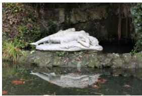
Statue de Fleurette.

Parc du 16e siècle situé rive droite juste à côté du Pont-Neuf, sur la rive droite de la Baïse. Promenade de 2 km plantée d'ormeaux, d'érables et de frênes, avec des rochers créant des effets pittoresques. Aménagé vraisemblablement par Henri Ier d'Albret. Agrandi au nord par Antoine de Bourbon qui acquiert l'espace face au château.