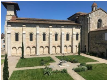
La cour du Prieuré.

Prieuré clunisien Sainte-Marie situé au village. Fondé en 1049 par Guillaume de Moyracho. Cette abbaye comprenait l'église, le couvent avec sa cour carrée et le cloître dont on peut distinguer les traces sur les murs du couvent. Celui-ci fut entièrement détruit à la révolution.