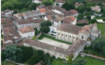
L'ensemble, vue d 'avion.