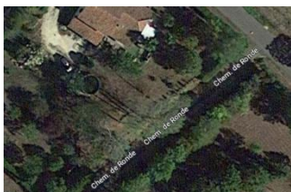
Tour au nord-ouest.

Enceinte collective du 13 e siècle enfermant totalement le castelnau sur les côtés nord, ouest et sud, l'est étant clôturé par l'ensemble château-église, lui-même fortifié.