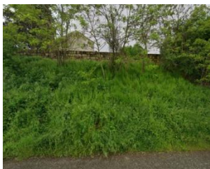
Murs au nord-est.