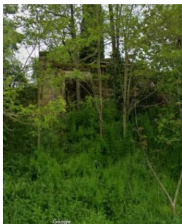
Contrefort au nord.