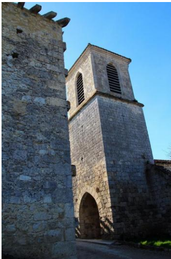
Eglise Saint-Martin (clocher)

L'église, contigüe à la porte du village, semble dater de la 2e moitié du 13e siècle (maçonnerie en moyen appareil, portail nord en arc légèrement brisé aujourd'hui bouché, lien avec l'enceinte fortifiée). Elle est peut-être bâtie sur un édifice antérieur comme en témoigne l'existence d'un chevet plat à l'extérieur et courbe à