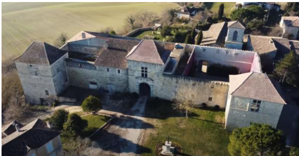
Château de Fimarcon (vue de devant)