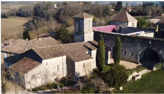
Eglise Saint-Martin (vue d'ensemble)