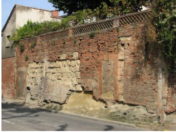
Vestiges des remparts, boulevard Marceau.