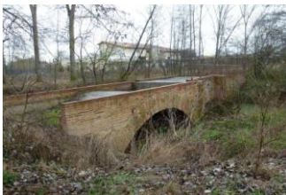
Pont Peyrin ?