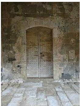
L'entrée sous le porche.