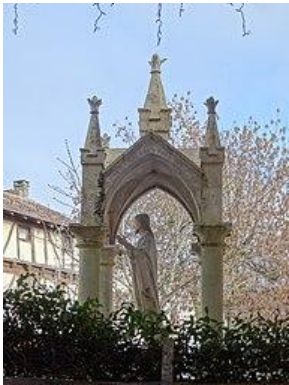
Statue à côté de l'église.

Eglise du 12 e siècle située au lieu-dit Rouillac à 3 km au sud du village. en bordure de la départementale 19. Clocher-mur. Emban à piliers au sud. Porche latéral à arcades. porte occidentale du 17 e siècle. Nef terminée par un chevet semi-circulaire, flanqué d'une sacristie.