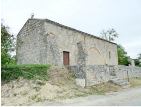
Eglise d'Estrépouy (vue d'ensemble)