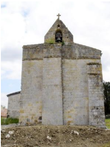
Eglise Notre-Dame de la Plagne de Nautèry (clocher-mur)

Eglise du 13 e ? siècle, située à 2 km au nord-est du village, dans un vallon à 800 m du hameau de Blans (44° 01' 03" nord, 0° 28' 22" est). Véritable enclos paroissial avec un clocher-mur roman, un porche, un cimetière, une ancienne maison du sonneur de cloche et un presbytère. L'église a été laissée à l'abandon entre 1800 et 1970.