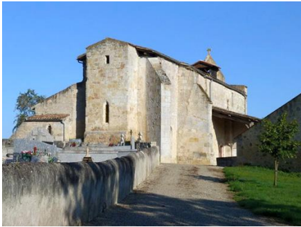
Eglise Notre-Dame de la Plagne de Nautèry (vue d'ensemble)