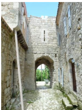
Porte en arc brisé (vue arrière)

Le village a conservé ses remparts d'origine du 13 e siècle. L'enceinte présente une forme presque carrée, aux angles abattus, d'environ 100 m de côté. Elle est doublée par un fossé presque totalement disparu. La porte sud a disparu. La porte nord est en arc brisé et prolongée par un couloir à berceau voûté menant à l'église. Elle a fait l'objet d'une reconstruction à la fin du 20 e siècle et au début du 21 e siècle.