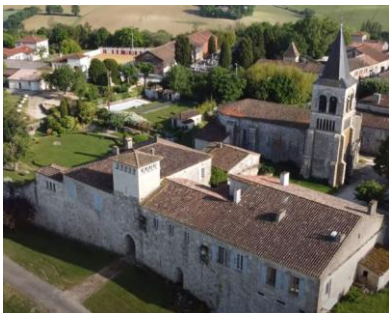
Porte en arc brisé (menant à l'église)