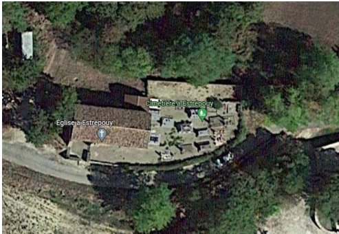
Eglise d'Estrépouy (vue aérienne)