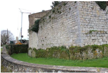
Fortification (front nord vue depuis l'ouest)