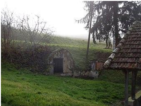
La fontaine associée.

Lavoir du ? e siècle situé en contrebas du village côté est, en bordure de la départementale 65.