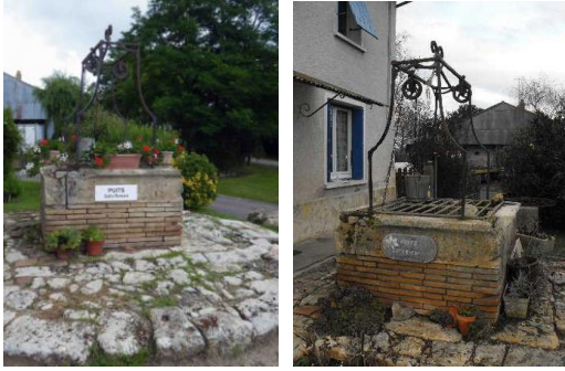
* Puits gallo-romain situé devant le cimetière.