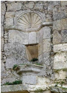
Niche avec coquille.

Château du 16 e siècle situé au lieu-dit Gachepouy à 2 km à l'est du village, sur une motte circulaire. Construit initialement au 14 e siècle, doté de bouches à feu au 16 e siècle. Reconstitué et aménagé en résidence de 1579 à 1584 pour Anne d'Aydie-Guittinières, baronne de Pordéac. Élévation d'une tour avec escalier en 1601 (aujourd'hui disparue), pour Catherine des Fontaines d'Hébrail, par Raymond Salles, maître maçon de Lavit-de-Lomagne.