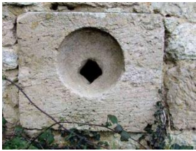
Bouche à feu.