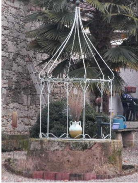
* Puits du village situé à ?