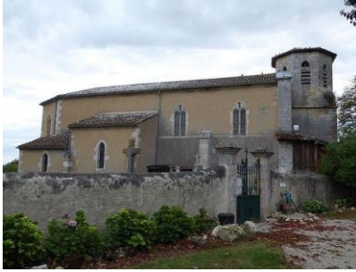
L'église et le cimetière adjacent.