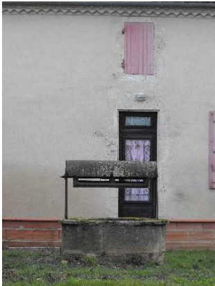
* Puits du village situé à ?

(cf https://www.communes.com/photo-castet-arrouy,364548 et https://fr.wikipedia.org/wiki/Castet-Arrouy et http://fontaineslavoirs.canalblog.com/archives/2009/11/06/15269225.html )