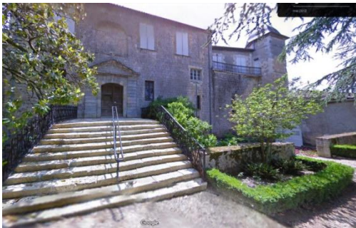
Façade vue nord.

Château du 13 e siècle situé au village, ancienne résidence d'été des évêques de Condom. Château construit en 1247 par Montassieu de Galard, abbé de Condom, sur les murailles d'un ancien château gascon.