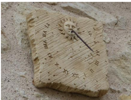
Cadran de série

Cinq cadrans solaires existent dans le village : un scaphe, un occidental, un méridien, un analemmatique et un cadran de série.