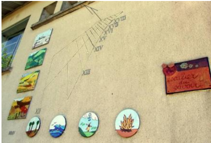
L'occidental (sur mur de l'école)