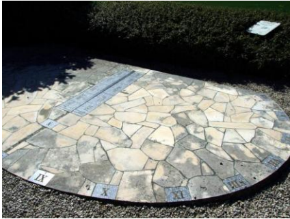
Cadran analemmatique (à l'entrée du village, juste avant l'église)