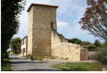
Tour et pan de mur d'enceinte (parcelle AC 50), vue depuis le sud-est.