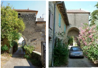
Porte de la ville.

La fortification du village est constituée par une enceinte, une tour et une porte de ville. Le mur d'enceinte a d'abord été bâti puis les maisons ont été ensuite construites à l'intérieur de celui-ci en venant s'appuyer contre lui et selon un urbanisme pensé et voulu par le seigneur des lieux. Fortification disparue en partie au 19 e siècle. Le tracé de la fortification, entre la tour et la porte de ville, reste visible sur le plan cadastral. Le village fortifié et le château semble avoir été séparés par un espace laissé vide formant ainsi une lice.