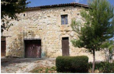
Maison et pan de mur d'enceinte (parcelle AC 45).